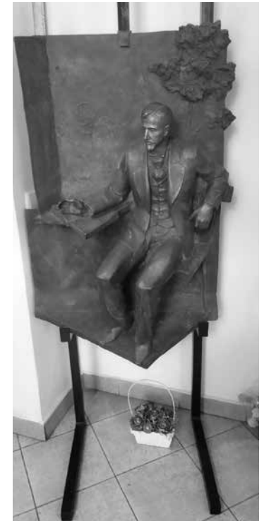
В библиотеке им. И.А. Бунина. Москва