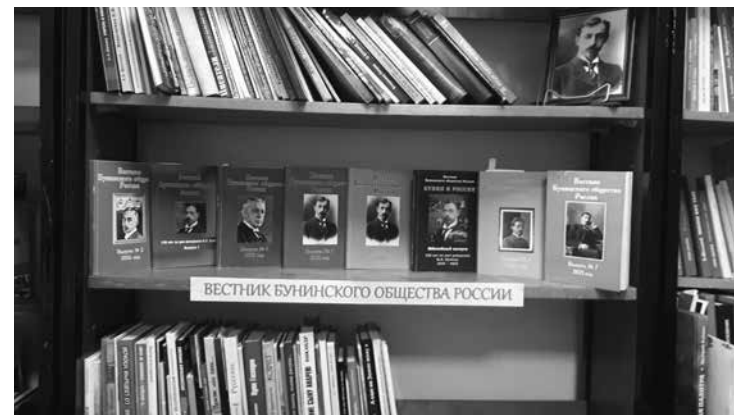
В библиотеке. Измалково