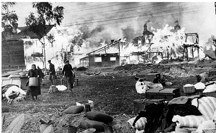
В фашистском огне — дома и жители Ленинградской области. Год 1941-й.

Да, поднятый в преддверии 70-летия Великой Победы на страницах нашей газеты вопрос о достойном увековечении памяти