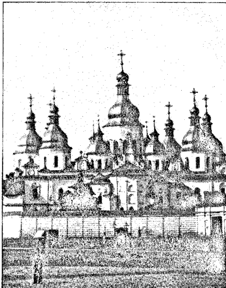
Соборъ св. Софіи въ Кіевѣ.

Борисъ получилъ вѣсть о кончинѣ отца на берегу рѣчки Альты. Горько оплакивалъ молодой князь кончину родителя, а дружина звала его въ Кіевъ противъ Святополка, уговаривала занять мѣсто отца. «Не подниму рукъ на старшаго брата! Старшій братъ мнѣ будетъ отца вмѣсто», такъ говорилъ Борисъ про Святополка. Тогда дружина ушла отъ него, и онъ остался лишь съ немногими отроками. Ночью подкрались къ шатру князя подсланные Святополкомъ убійцы. Князь стоялъ на молитвѣ и громко пѣлъ псалмы. Злодѣи пробили копьями полотно шатра и закололи Бориса, потомъ завернули его въ полотно и помчали въ Кіевъ къ Святополку. Настрѣчу убійцамъ шли два варяга, посланные Святополкомъ. Увидя, что Борисъ еще дышитъ, одинъ изъ нихъ мечомъ пронзилъ ему сердце.