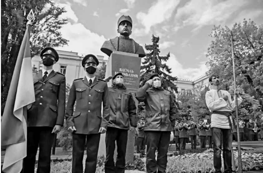
Торжественное открытие памятника Василю Вышиваному (Вильгельму Габсбургу) 20 мая 2021 г. в Киеве у станции метро «Лукьяновская».

ской армии и командиром так называемого легиона Украинских сечевых стрельцов 2 .