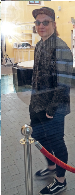
Во дворе Литературного института им. А.М. Горького. Фойе театра «Геликон-опера», перед спектаклем