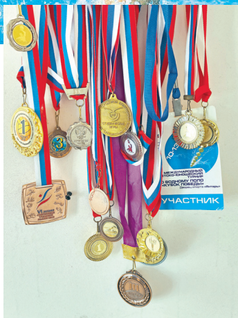
Водное поло, игровой момент. Медали, завоёванные в составе команды Московской области