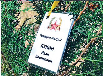
Севастополь. 20.11.2022 г. Аллея Героев