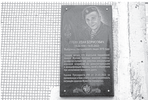
Мемориальный камень на улице Гвардии матроса Ивана Лукина. Мемориальная доска на Нестеровском лицее