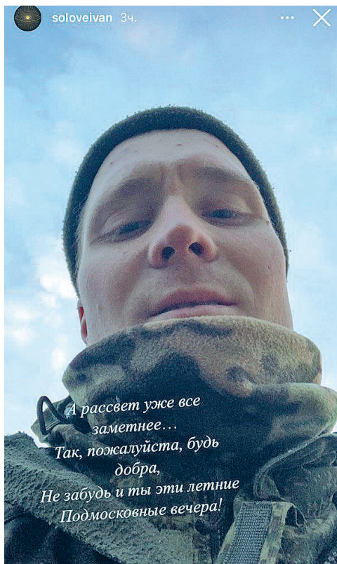
Фотописьмо с фронта