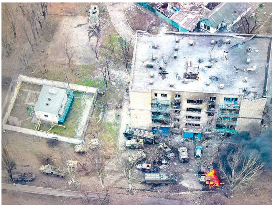
Мариуполь. 13 марта 2022 г. Начало атаки противника на российскую разведгруппу