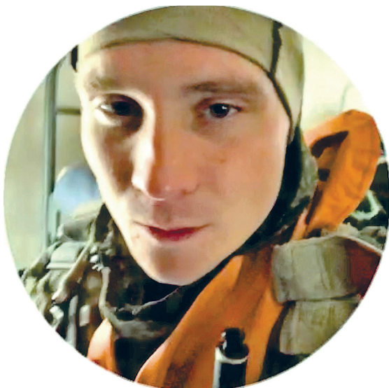
Перед очередным прыжком с парашютом