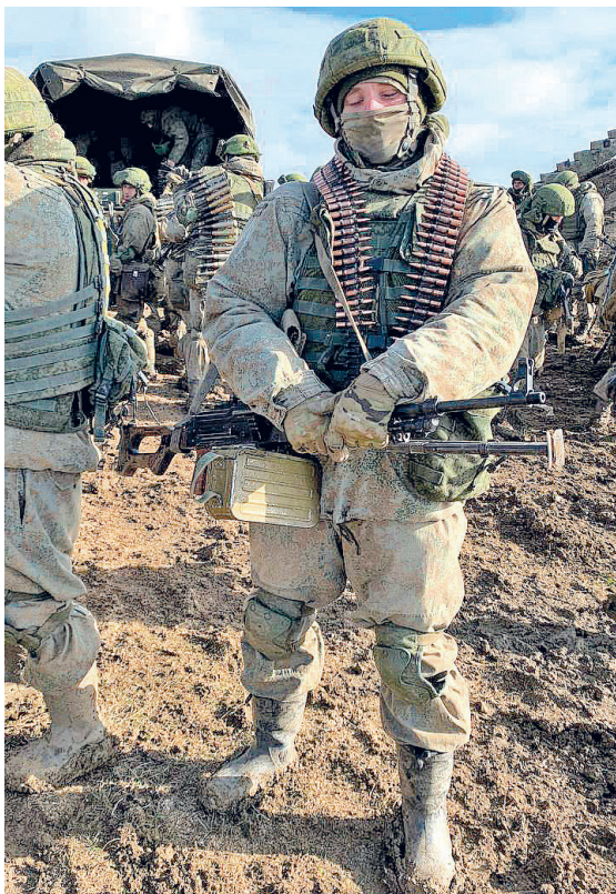
Скоро в поход