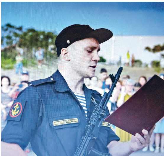
Севастополь. День присяги, 02.08.2020. Музейный историко-мемориальный комплекс «35-я береговая батарея» в Казачьей бухте