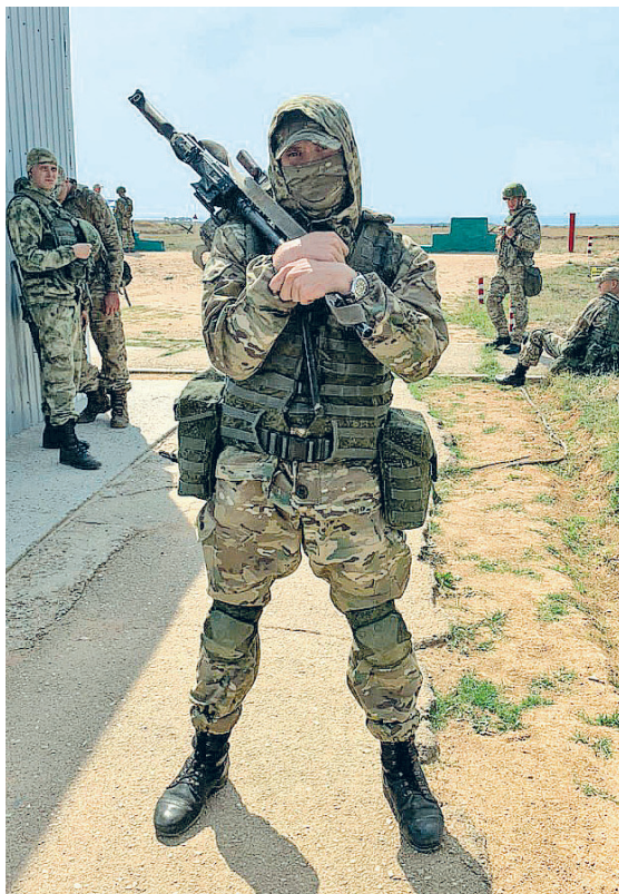
Снаряжён. Готов к бою