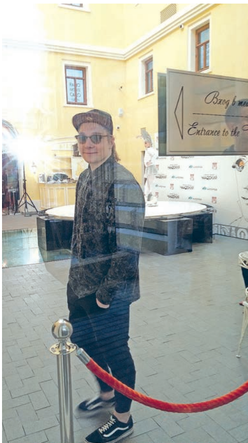
Фойе театра «Геликон-опера» перед спектаклем