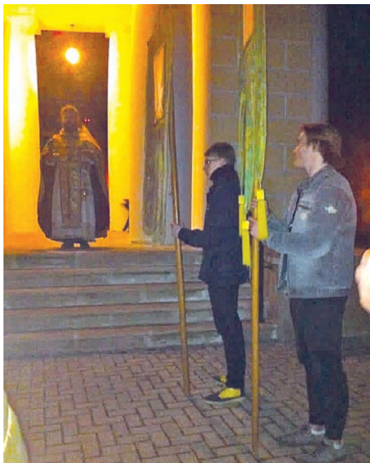
Пасха Христова. Крестный ход, 2018 г. Церковь Архангела Михаила, с. Архангельское