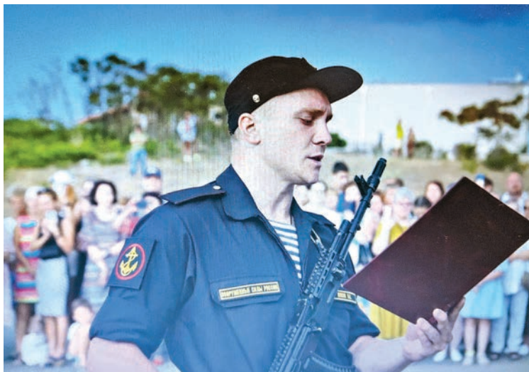
Севастополь. День присяги, 02.08.2020. Музейный историко-мемориальный комплекс «35-я береговая батарея» в Казачьей бухте