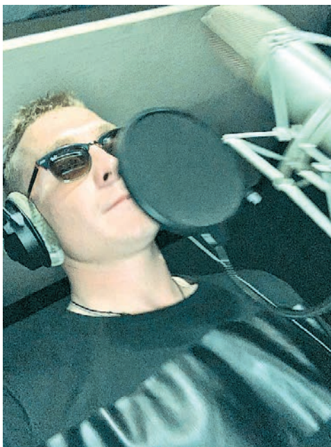
Симферополь. 2021 г. Студия звукозаписи. Создание композиции «Облака»