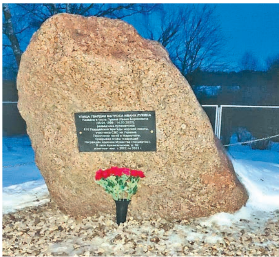
Мемориальный камень на улице Гвардии матроса Ивана Лукина