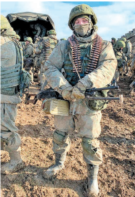
Скоро в поход