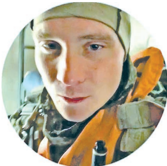
Перед очередным прыжком с парашютом