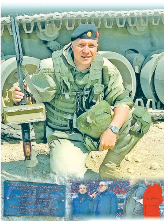
Фотоподарок от земляков-ружан. Фотомонтаж