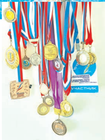
Водное поло, игровой момент. Медали, завоёванные в составе команды Московской области