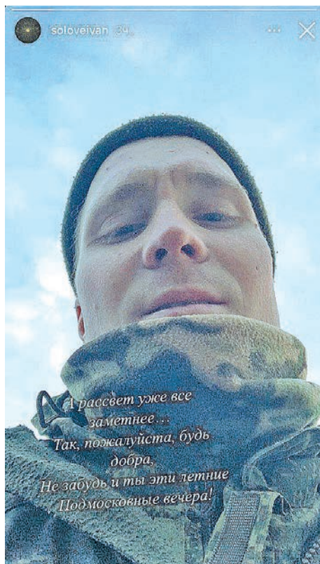
Фотописьмо с фронта