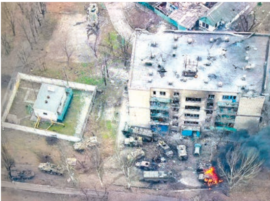
Мариуполь. 13 марта 2022 г. Начало атаки противника на российскую разведгруппу