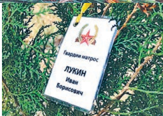
Севастополь. 20.11.2022 г. Аллея Героев