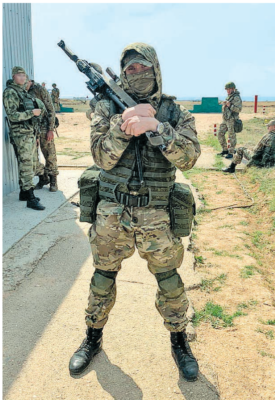
Снаряжён. Готов к бою