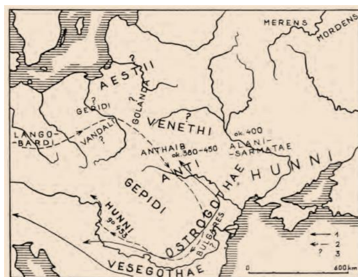
The territory of Eastern Europe at the beginning of the Migration Period

As for the territory of the Kiev region, ca. 400 AD (after the defeat of the Goths by the Huns), those lands were no longer controlled by the East Germanic peoples, but by the Sarmato-Alanian tribes (see the work by D. Machinskii). 75 Let us compare the opinion expressed by E. Shmurlo in the 1920s that in the area of ancient Kiev there could be a Sarmatian camp or the city of Metropolis. 76 This view is supported by some of the modern historians. 77